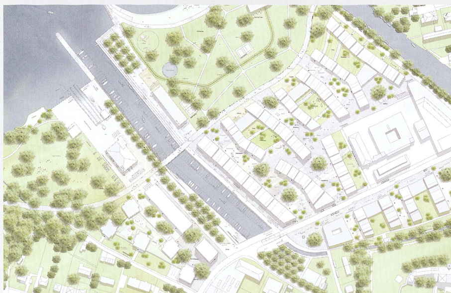
Fig.1 © bauzeit architekten