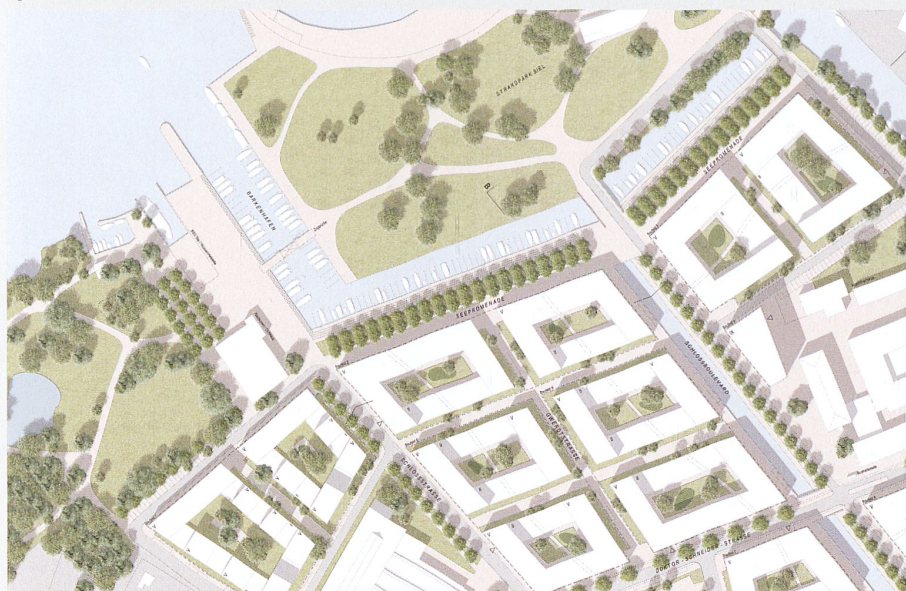
Fig. 2 © baukontor ag

dans le foyer de la Résidence Au Lac, à deux minutes de la gare de Bienne, que les discussions se sont nouées. Les espaces verts prévus sont-ils à l'échelle d'une population de près de 60 000 habitants? Rapproche-t-on la ville du lac en construisant des petits ensembles entre lesquels glisser des buissons et des bouts de prairie? Ou aurait-il été préférable d'ériger de vrais îlots urbains, de prolonger le port de plaisance et de créer ainsi une nouvelle promenade au bord de l'eau, comme l'a proposé l'équipe baukontor, autour de Vittorio Magnago Lampugnani (voir fig. 2)?