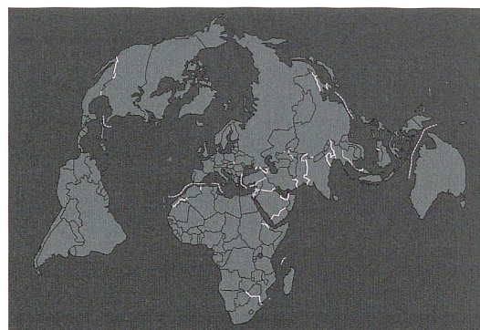
Planisphère, les murs et barrières dans le monde (conception Stéphane Rosière; réalisation Sébastien Piantoni - Université de Reims - 2015). Adaptation Valérie Bovay