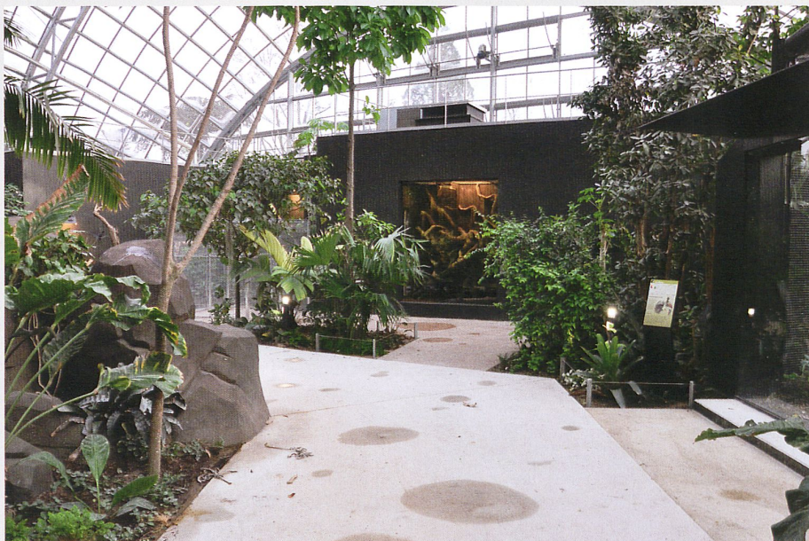
Les vivariums ouverts accueillant les reptiles dans la serre tropicale font partie des habitats créés par el hassani & keller au zoo de Vincennes

Dans un marché assez fortement réglementé comme la France, outre la patience, il faut mettre beaucoup de cœur à l'ouvrage. Mais une fois qu'on a assimilé les règles spécifiques au pays, on finit par se prendre au jeu, avec le savoir-vivre propre au quotidien des affaires. Les contacts se nouent autour d'un verre de vin et les contrats se finalisent lors d'un dîner. Pour Keller, un des grands