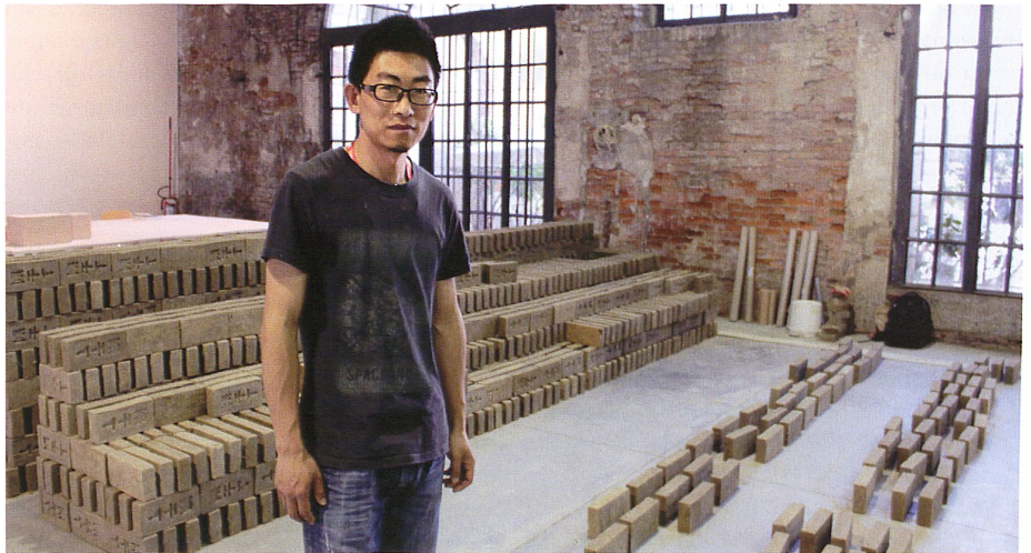
Untitled 2015 (14,086), le Thaïlandais Rikrit Tiravanija, Arsenal

Un beau programme de performances au fil des expositions mais aussi dans un espace dédié, l'Arena, amène une dimension vivante fort appréciable. Cette édition se révèle toutefois figée dans son format, et les questionnements peu généreux à l'égard du public qui doit se promener avec son guide s'il veut mieux saisir ce qui se joue dans la confrontation des œuvres. Avec poésie et modestie, avec un humour empreint de la gravité que donne toute observation attentive des états du monde, les œuvres réunies résonnent longuement et dessinent un horizon collectif plutôt sombre. Elles naissent de la rencontre entre le proche et le lointain, entre le dedans et le dehors, entre des réalités maintenues séparées par l'organisation des sociétés. Il est plus que jamais nécessaire de penser un événement tel que la biennale comme