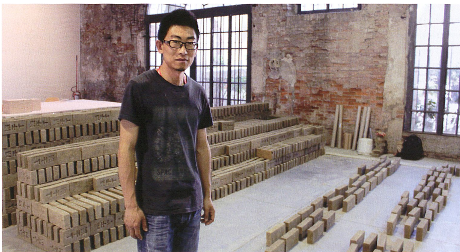
Untitled 2015 (14,086), le Thaïlandais Rikrit Tiravanija, Arsenal

Un beau programme de performances au fil des expositions mais aussi dans un espace dédié, l'Arena, amène une dimension vivante fort appréciable. Cette édition se révèle toutefois figée dans son format, et les questionnements peu généreux à l'égard du public qui doit se promener avec son guide s'il veut mieux saisir ce qui se joue dans la confrontation des œuvres. Avec poésie et modestie, avec un humour empreint de la gravité que donne toute observation attentive des états du monde, les œuvres réunies résonnent longuement et dessinent un horizon collectif plutôt sombre. Elles naissent de la rencontre entre le proche et le lointain, entre le dedans et le dehors, entre des réalités maintenues séparées par l'organisation des sociétés. Il est plus que jamais nécessaire de penser un événement tel que la biennale comme