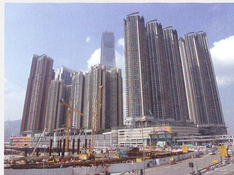
Chantier à Hong Kong

La Suisse était présente avec deux experts en énergie au forum annuel du Hong Kong Institute of Engineers (HKIE), qui s'est déroulé le 17 avril 2015 au Centre des expositions et des congrès de Hong Kong. Cette ville passe pour l'une des places économiques les plus libérales, les plus sûres et les plus attractives sur le plan financier. Cependant, ces avantages ont aussi leur revers. La mégapole et ses habitants ont depuis longtemps été rattrapés par les émissions liées au boom économique et par les problèmes de gestion des déchets et des eaux usées. Face à la part des bâtiments dans la consommation d'électricité, qui atteint 90%, et aux nombreuses tours des années 1960-1980, il est urgent d'agir rapidement dans ce domaine aussi. Depuis les premières incitations économiques et mesures volontaires jusqu'au Building Efficiency Code, devenu depuis obli-