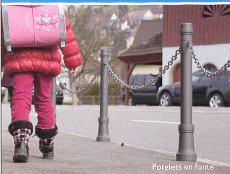
Potelets en fonte