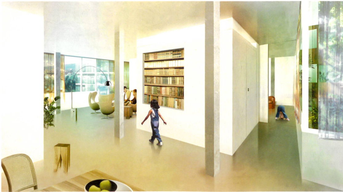
1 La construction en poteaux-dalles permet de proposer des espaces différenciés (perspective de concours d'un espace de séjour)

unités privatives avec chambres, salle de bain, cuisine et parfois un petit salon, agrégées au sein d'un vaste espace de vie collectif.