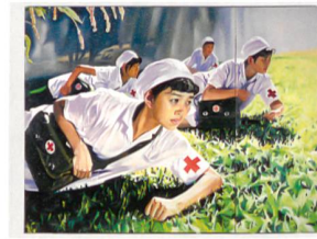
Jing Keven, Dream 2008, N°1 (Nurses), 2008

EXPOSITION CHINESE WHISPERS Œuvres récentes des collections Sigg et M+ Sigg Musée des Beaux-Arts de Berne et Zentrum Paul Klee www.zpk.org