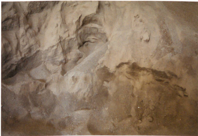
La terre séchée avant le conditionnement pour la formation des blocs