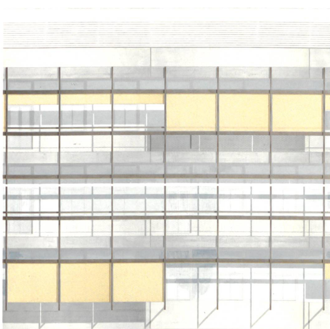
Image de la nouvelle façade de l'Amphipôle (© Aeby Pernegger & Associés)