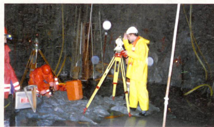
Grâce aux géomètres, les ouvrages sont érigés exactement à l'endroit prévu.

Au cœur de la montagne, il est impossible d'utiliser un GPS: autrefois, on s'orientait au moyen d'un cheminement polygonal à partir de chaque portail (mesure des points dans l'axe en déterminant les angles et les distances), alors qu'on recourt dorénavant à une triangulation sophistiquée. En d'autres termes, on crée un réseau très dense et sur-déterminé de points mesurés à plusieurs reprises. Le principe paraît simple, mais la tâche dans le tunnel ne l'est pas, car en plus de l'addition d'erreurs angulaires, des strates d'air chaud variables provoquent également des réfractions diverses de la lumière, c'est-à-dire du faisceau de mesure. Des erreurs et des divergences non négligeables peuvent en résulter. Il a fallu répéter souvent les mesures de contrôle et d'appui (dans ce projet, à peu près tous les deux kilomètres) à l'aide d'un gyrothéodolite (une toupie tournante qui