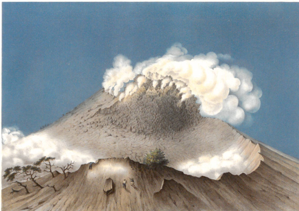
F. Junghuhn del.

Une exposition issue d'un projet de recherche du Future Cities Laboratory, au sein du Singapore ETH Center.