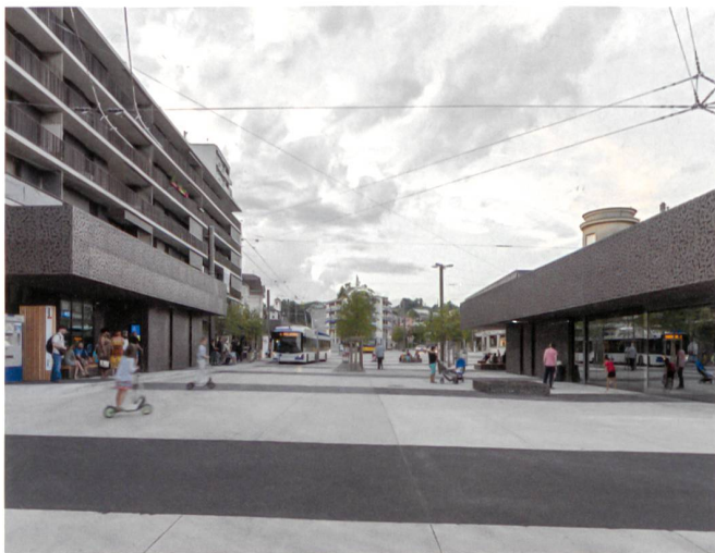
La Sallaz à Lausanne, nouvel espace partagé