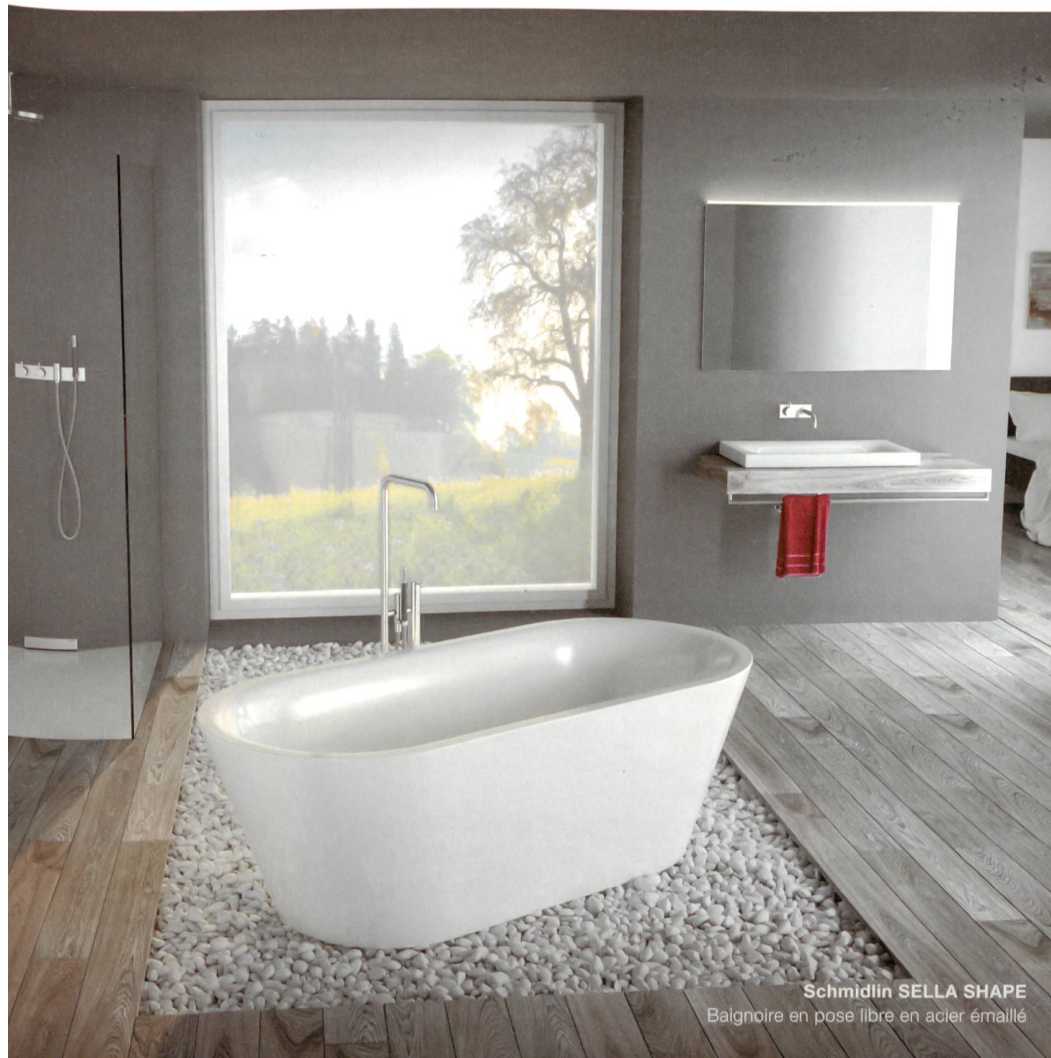
Schmidlin SELLA SHAPE Baignoire en pose libre en acier émaillé