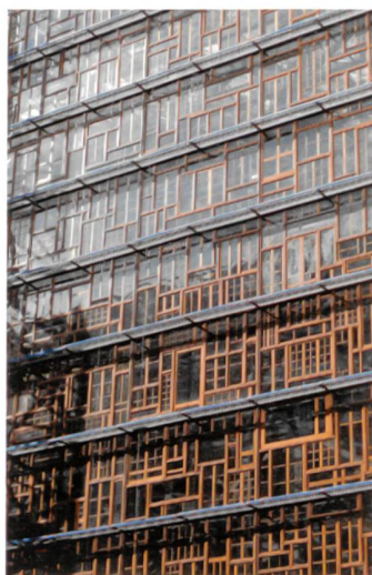
(© Philippe Samyn and Partners architects & engineers, Lead and Design partner)

EXPOSITION MATIÈRE GRISE F'ar, Lausanne www.archi-far.ch