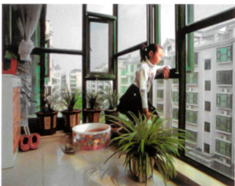
(© Su Sheng, Lili Wei. De la série Chinese Childhood, 2008)

EXPOSITION ANONYMATS D'AUJOURD'HUI. PETITE GRAMMAIRE PHOTOGRA- PHIQUE DE LA VIE URBAINE Quelle place la ville contempo- raine donne-t-elle à l'individu ? Musée de l'Elysée, Lausanne www.elysee.ch