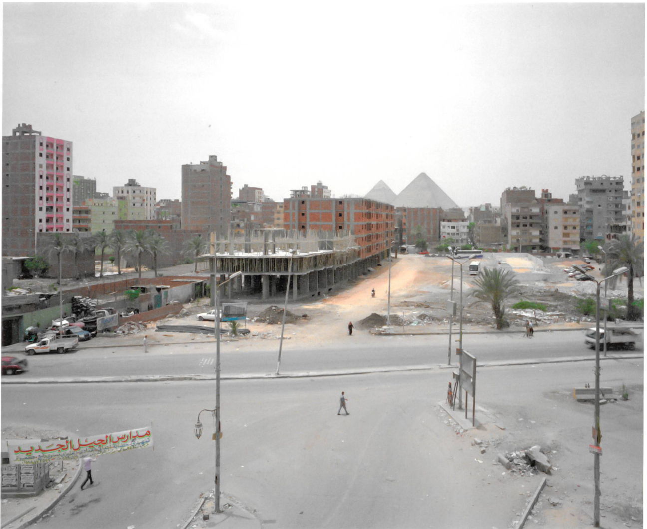
Cairo Ring Road Egypte, 2015

Surplus! Logements de la périphérie présente une sélection de photographies de Cairo Ring Road , un projet plus large sur le paysage urbain et architectural du Caire. Ces photographies, prises en périphérie de la ville, dépeignent l'ampleur et l'excès de la construction d'immeubles résidentiels, la forte densité et les vues dystopiques souvent désertes de logements du Caire contemporain. Des millions de mètres carrés de biens immobiliers inoccupés encerclent la banlieue du Caire. Le boom résidentiel de la dernière décennie a produit une surabondance de logements excessivement chers et pauvrement construits qui sont hors de portée géographiquement et économiquement pour la majorité des Cairotés. Le boom immobilier a également existé pour le secteur informel de la construction qui a approvisionné le marché de quartiers informels où habitent deux tiers des habitants de la ville.