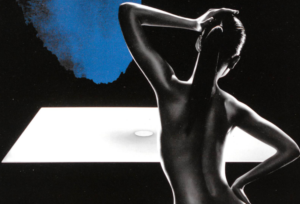
Surface de douche SCONA