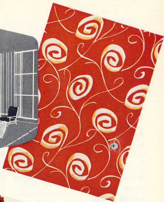
Zur Auflockerung des Wohnraums mit grünem Sofa, beigen Sesseln: Vorhänge und Sofakissen aus leuchtend rotem Chintz, übersät mit spielerischen Ornamenten.