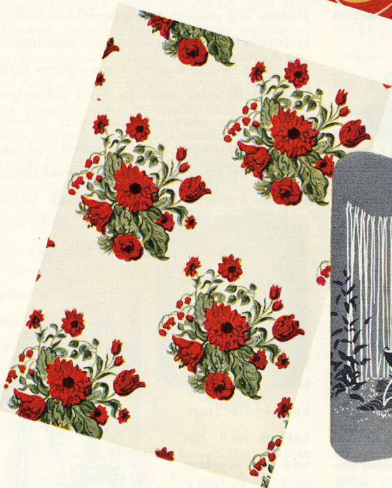
Die naturalistischen, fröhlichen Mohnsträuße des hellen Chintz beleben ein hellgrundiges Zimmer mit leichten Möbeln.