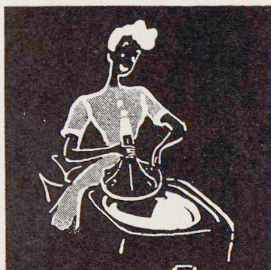
Nochmals drehen und die Wäsche wird gespült