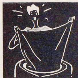
Nun windet die Maschine gründlich aus