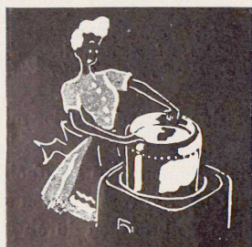
In den Geschirr-Einsatz wird schmutziges Geschirr gelegt