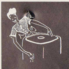
Eine Drehung am Knopf und das Vorwaschen beginnt

wasserhahn, die Wasch- oder Schleudermaschine einzustellen, das nötige Waschmittel hinzuzufügen und vielleicht noch auf die Uhr zu schauen, um uns immer wieder freudig zu vergewissern, daß tatsäch-