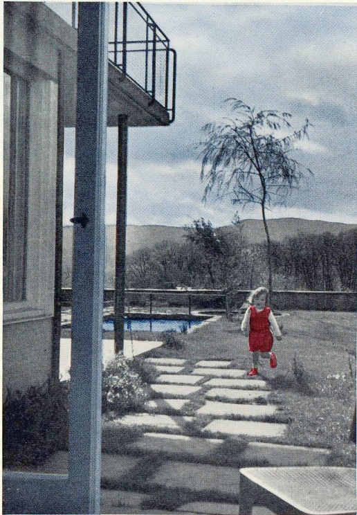
Die Türe der Halle zum Garten öffnet schon jedem den Blick in die Blumen, auf Bäume, Kinderspielplatz...