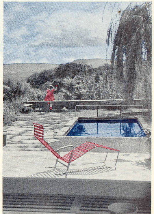
... und Planschbecken und Sandhaufen bilden natürlich das wunderbarste Kinderparadies, das man sich denken kann.