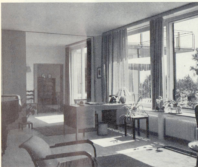
Blick vom großen Wohnraum durch die geöffneten Schiebetüren in Halle und Eßzimmer. Weit, angenehm gelöst und dazu bestimmt, viele heitere Menschen in sich aufzunehmen, sei's die Kinderschar am Tag, seiens die Gäste am Abend.

Planschbecken. Rechts davon liegt der große Wohnraum, ein Raum voll von Licht, von Blumen, alte und neue Möbel. Er gehört den Erwachsenen, ihrer Musik, ihren Besuchern. Links dagegen, im Eßzimmer und auf der windgeschützten, überdeckten Gartenveranda, wo im Sommer auch gegessen wird, spielen tagsüber die Kinder. Dahinter liegt die Küche, liegt das Zimmer der Magd. Sind die Schiebetüren zwischen dem Wohnraum – wo am späten Nachmittag die Sonne weit durchs große Blumenfenster an der Westecke flutet – der Halle und dem Eßzimmer geschlossen, so ist dort drüben, beim Flügel, beim Kamin, kaum etwas vom Lärm der Kleinen zu hören. Sind die Türen jedoch offen, etwa am Abend, wenn Gäste kommen, so ergibt sich ein behaglicher, lösender Eindruck von Größe und Weite.