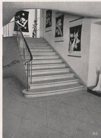
Treppe und Bodenbeläge in einem Geschäftshaus. Material: heller Basaltolit-Quarzit

Treppenanlagen, Fassadenverkleidungen Betonfenster, Bodenplatten