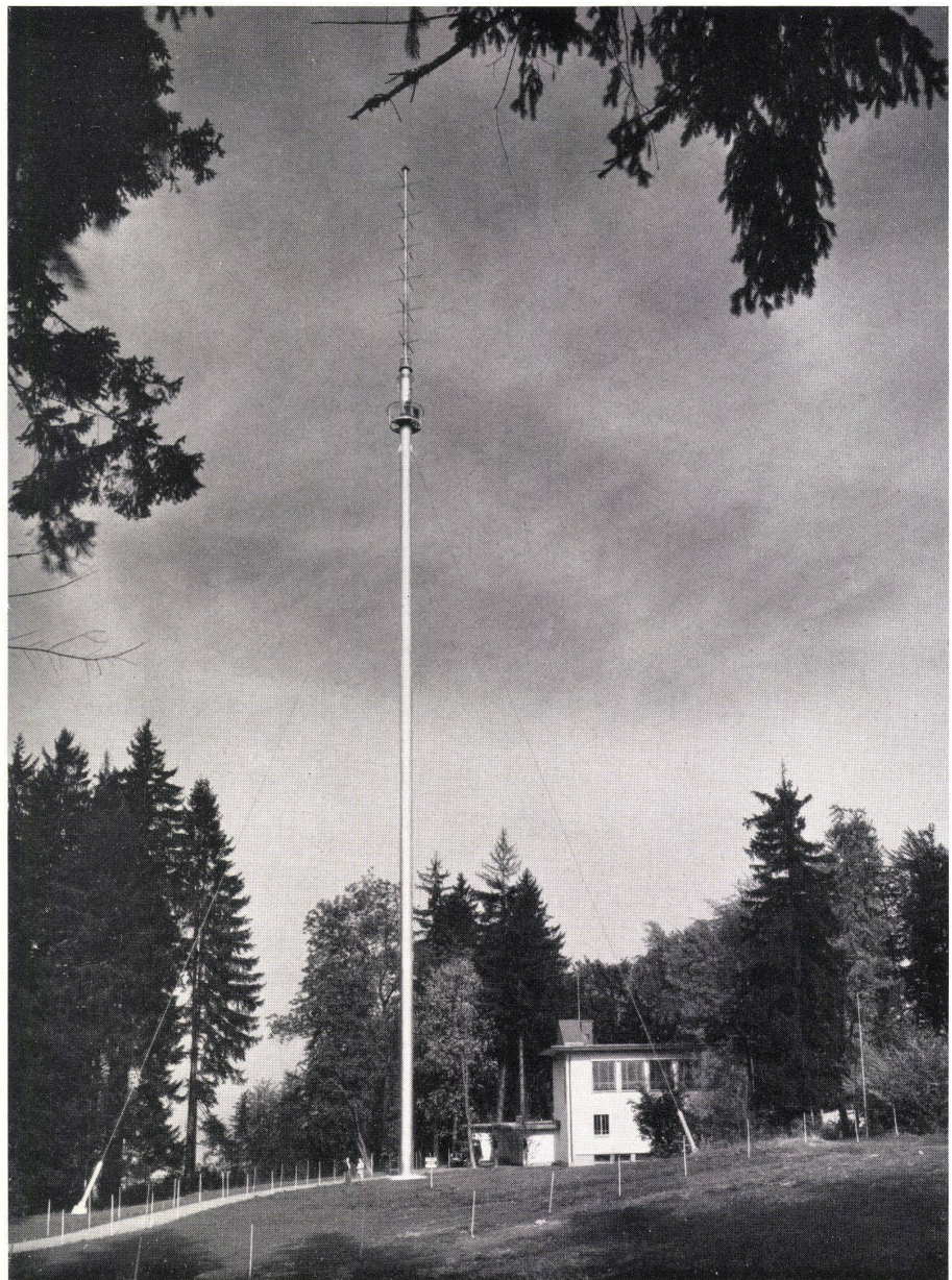
Gesamtansicht. Vue totale. Overall view.

In der Werkstätte in Pratteln wurden 10,5 m lange, fertig geschweißte Rohrabschnitte hergestellt, die dann auf die Baustelle transportiert, hochgezogen und verschraubt wurden. Bei der Einleitung der Seilkräfte in das Rohr sind (im Innern) die erforderlichen Aussteifungen angebracht. Das Äußere des Turmes wurde spritzverzinkt und mit einem porenfüllenden Anstrich versehen. Das Innere, das für Unterhaltsarbeiten leicht zugänglich ist, wurde ein-