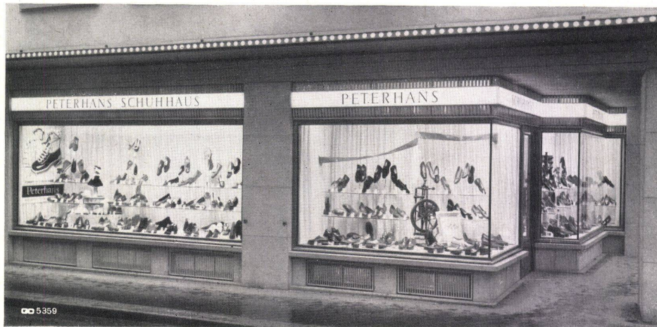
Geilinger & Co. Winterthur