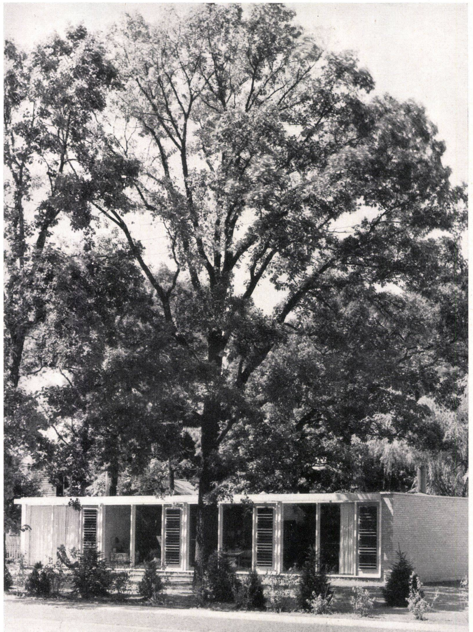
Gesamtansicht von Südosten mit der verglasten Südfront. Vue générale prise du sud-est, montrant aussi la paroi vitrée donnant au sud. Overall view from the south-east showing glazed south-facing front.

Architekten: Crombie Taylor und Robert Bruce Tague, Chicago