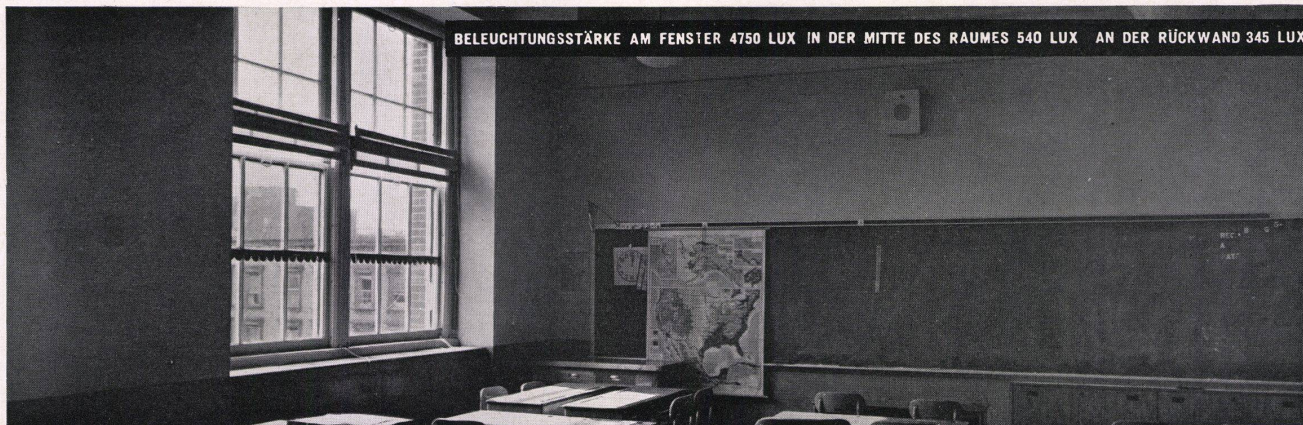
BELEUCHTUNGSSTÄRKE AM FENSTER 4750 LUX IN DER MITTE DES RAUMES 540 LUX AN DER RÜCKWAND 345 LUX

Ein „nacktes“ Fenster verursacht Lichtverlust, die hintere Seite des Raumes bleibt dunkel.