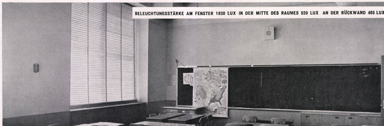
BELEUCHTUNGSSTÄRKE AM FENSTER 1830 LUX IN DER MITTE DES RAUMES 520 LUX AN DER RÜCKWAND 465 LUX

Ein „nacktes“ Fenster verursacht Lichtverlust, die hintere Seite des Raumes bleibt dunkel.