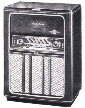
Modell GRAZIOSO Fr. 845.- Besonderheiten und Verkaufs- argumente: 8/10 Kreise; 7 Röh- ren; drehbare Ferritantenne mit optischer Anzeige. Plattenspieler oder 10-Platten- wechsler mit 3 Geschwindig- keiten.

Verlangen Sie bitte bei Ihrem Fachhändler Prospekte über das gesamte GRAETZ Radio- und Fernsehprogramm. Sie werden gerne unverbindlich beraten. Bezugsquellennachweis: HEIMBROD, STAMM & CO. AG., BASEL 2