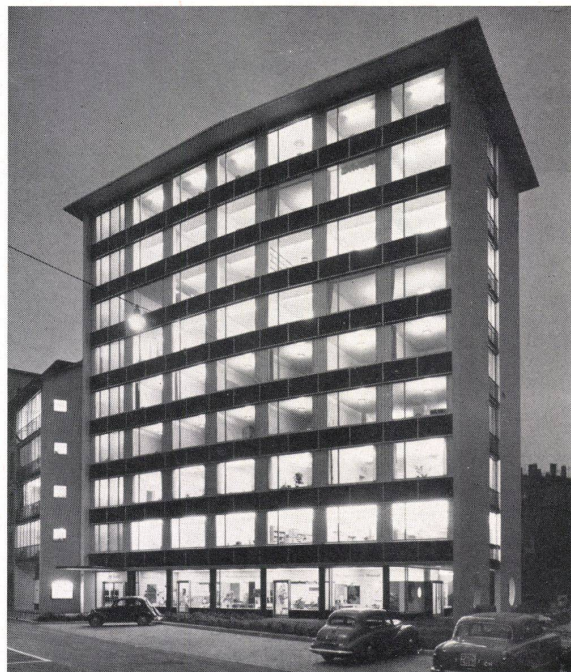
Die Fassadenverkleidung in Carrara-Glas sowie die Lieferung und der Einsatz von Polyglas für die Fenster wurden ausgeführt durch:

«Häßlichkeit verkauft sich schlecht» no. – Das Bemühen um die «gute Form» führte schon vor dem ersten Weltkrieg in den Vereinigten Staaten zur Gründung