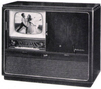
Modell MAHARADSCHA Fr. 2875.- Besonderheiten und Verkaufsargumente: 4-R-Raum- klang-Fernseh-Luxus-Musiktruhe mit 43 cm Bildröhre, 23+1 Röhren plus 5+1 Germaniumdioden und zwei Selengleichrichter. Ein Modell, das auch den höchsten Ansprüchen gerecht wird!