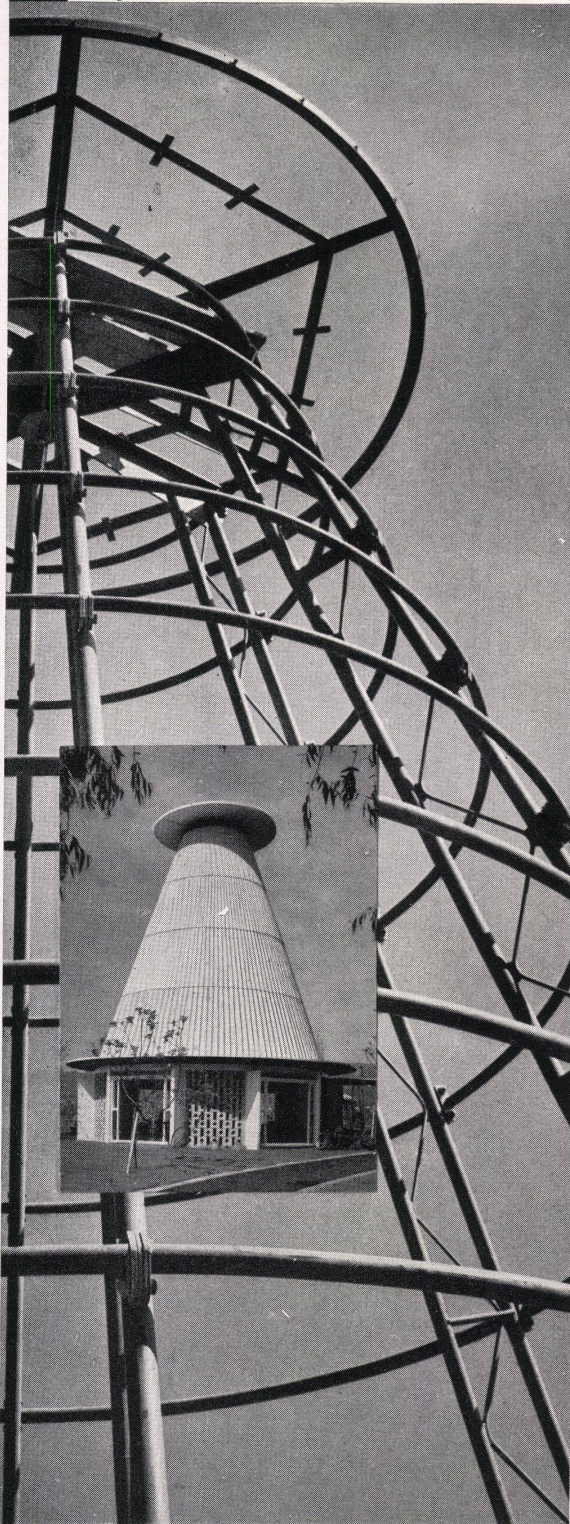
Teepavillon des Strandbades Tiefenbrunnen, Stahlskelett und fertiges Bauwerk

Josef Schütz BSA/SIA Otto Dürr BSA Willy Roost, Architekten, Zürich