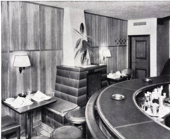
Die bekannte Schifflände-Bar in Zürich

Neue bautechnische Möglichkeiten ergeben sich weiterhin durch mattiertes Drahtglas, das heißt durch ein Drahtglas, in dem durch einen Mattierungsprozeß die sichtverwehrenden Eigenschaften noch mehr gesteigert sind als beim normalen Drahtglas. Damit erlangt das Gußglas interessante optische Eigenschaften, deren Kenntnis von Architekten und Bauingenieuren in geschickter Weise ausgenutzt werden. Die ehemals glatte Fläche des Glases ist beim matten Drahtglas in eine Vielzahl kleiner Flächen, die zueinander verschiedene Neigungswinkel haben, zerlegt, so daß das Licht nicht mehr als parallel gerichtetes