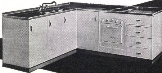
MENA-LUX AG. MURTEN vormals La Ménagère AG.