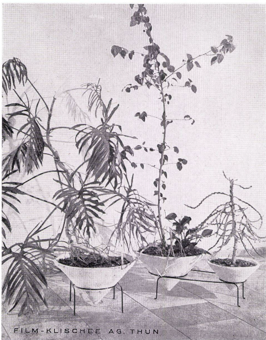
FILM-KLISCHEE AG. THUN