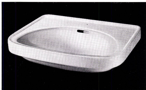
Der formschöne Waschtisch «MAYA» Nr. 4220/21 SWB-Auszeichnung: «Die gute Form 1959»