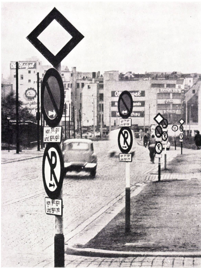
Der unlesbare Schilderwald an einer Hamburger Verkehrsstraße.

falschen Regulativen, falscher Ethik, falschen Maßstäben, falschen Planungsmethoden und falschen Zuständigkeiten gekommen ist. Unsere Bemühungen nützen daher bisher wenig oder gar nichts, sie bewirken oft – wie jede angewandte Wissenschaft mit falschen Voraussetzungen – das Gegenteil. Sie vermehren das Unheil.