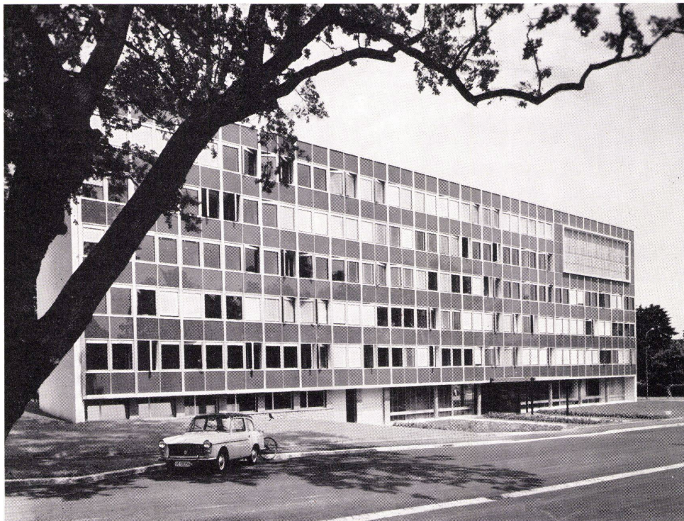
Organisation Météorologique Mondiale