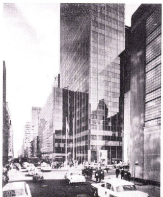
Der 28-Stockwerk-Wolkenkratzer der Corning Glass Works in New York.

Fiberglass ist auch für die schalldämpfenden Deckenkonstruktionen benützt worden. Es handelt sich hier um akustische Platten oder sogenannte «Sonofaced»-Ziegel; das sind geräuschabsorbierende Materialien aus Fiberglass, die mit einem