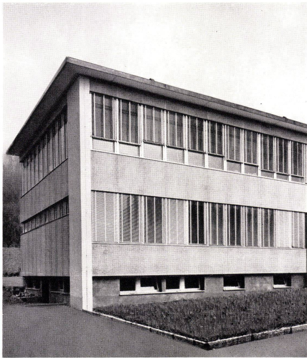
Am Neubau dieser Uhrenfabrik in Grenchen wurden die Vorhangbauelemente an der Trägerkonstruktion direkt mit GOMASTIT befestigt und verfügt.