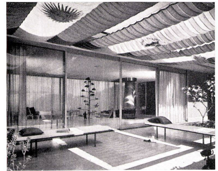
2 Eigenhaus 2, Arch. L. Ruocco. Maison no 2 de l'architecte L. Ruocco. The Architect's house no. 2, L. Ruocco.

Häuser gebaut, jedes ein Wurf für sich, jedes ein Stück weiter zu seinem Ziel: ein Minimum an greifbarer und sichtbarer Architektur geben, keinen Einbruch der Struktur in das Reich des Fühlens dulden, nicht zuviel auf Zuwenig verwenden. 1953 baute Ruocco für eine Home Show im Balboa-Park, San Diego, ein Musterhaus auf Acht-Fuß-Raster, aus der Post-and-Beam-Bauweise des Westens konzipiert, aber mit eigenen Zügen: geschweißte Stützen aus Stahlrohr ersetzen die schweren Holzpfosten; Dach, Decke und Fußboden bildeten vorfabrizierte Systeme aus verstärkten Sperrholzplatten. Die Räume blieben, bis auf Küche und Bad, völ-