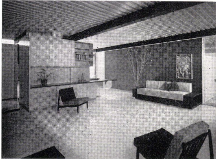
4 Sanders House in Palo Alto, Arch. Raphael S. Soriano.

Der Schlüssel zu dieser Meisterschaft: das aufs letzte vereinfachte Detail, das dem Stahlhaus in Sorianos Händen einen neuen Maßstab gibt.