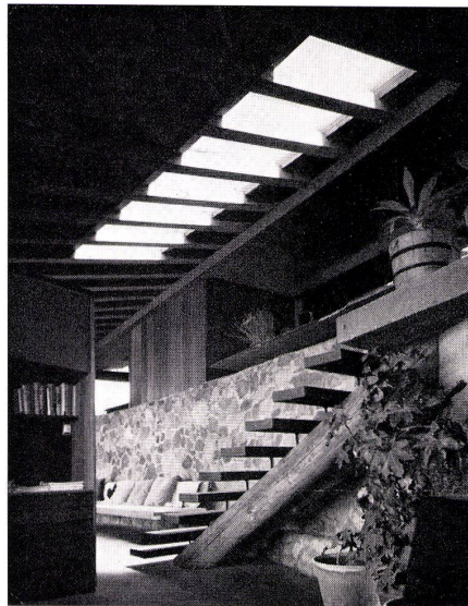
1 Eigenhaus 1, Arch. L. Ruocco. Maison no 1 de l'architecte L. Ruocco. The Architect's house no. 1, L. Ruocco.

Lloyd Ruocco, in San Diego tätig, umfaßt in seinem Werk das weiteste Spektrum von rustikalen Cottages bis zu schwerelosen Pavillons in Stahl und Glas. Seine beiden eigenen Häuser, im Abstand von zehn Jahren gebaut, zeigen die äußersten Zonen seines Schaffens. Das erste Haus, Il Cavo, ist rustikal »where nature proclaims all«, das zweite zeigt seine intellektuelle Richtung »where man proclaims all«.