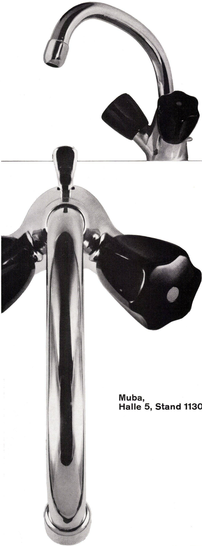
Muba, Halle 5, Stand 1130

Einloch-Waschtischbatterie Nr. 3072 mit schwenkbarem Auslauf und Ablaufventil