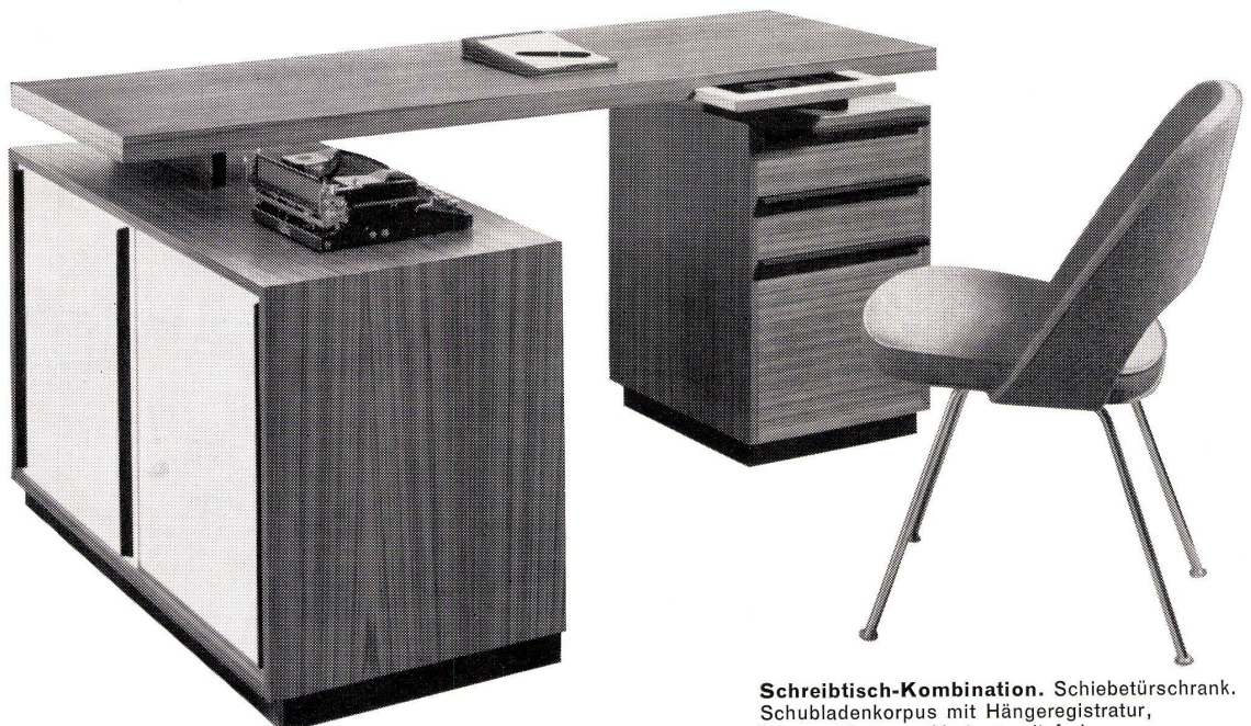
Schreibtisch-Kombination. Schiebetürschrank. Schubladenkorpus mit Hängeregistratur, in verschiedenen Varianten lieferbar.

Besuchen Sie unsere ständige Ausstellung in Weißlingen