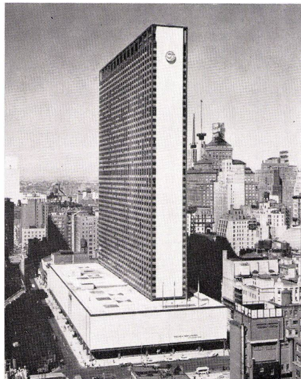
1 Hilton, New York, von William Tabler.