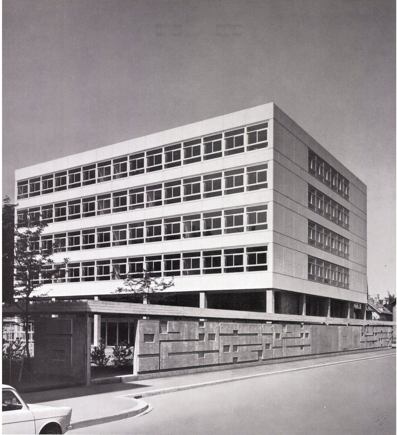
Gewerbeschule Zürich, Abteilung für Frauenberufe