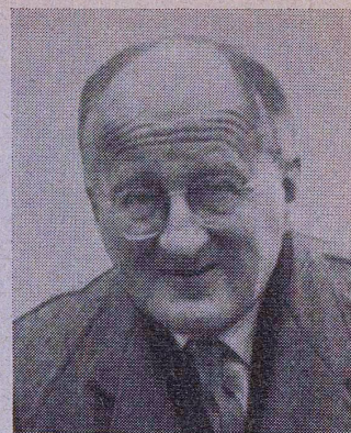
Nikolaus B. L. Pevsner

Geboren im September 1909 in Lancashire. Studium: Victoria-Universität, Manchester (School of Architecture). Arbeit in London, Leeds, Southampton und West Riding of Yorkshire. Chefarchitekt bei The London County Council und Greater London Council seit 1956. Mitglied: Royal Institute of British Architects. Advisory Committee on Building Research, Ministry of Technology 1959-67, Standing Conference on London Regional Planning 1963-65. Auszeichnungen: RIBA-Bronzemedaille, Civic Trust Awards, Ministry of Housing Award for Good Design in Housing, Architectural Design Grand Project Award.