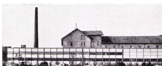
Jörg Affolter, dipl. Architekt ETH

U. Schärer Söhne AG-USM Stahlbau-System «Haller» 3110 Münsingen 031 68 14 37