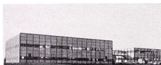
B.+F. Haller, Architekten BSA