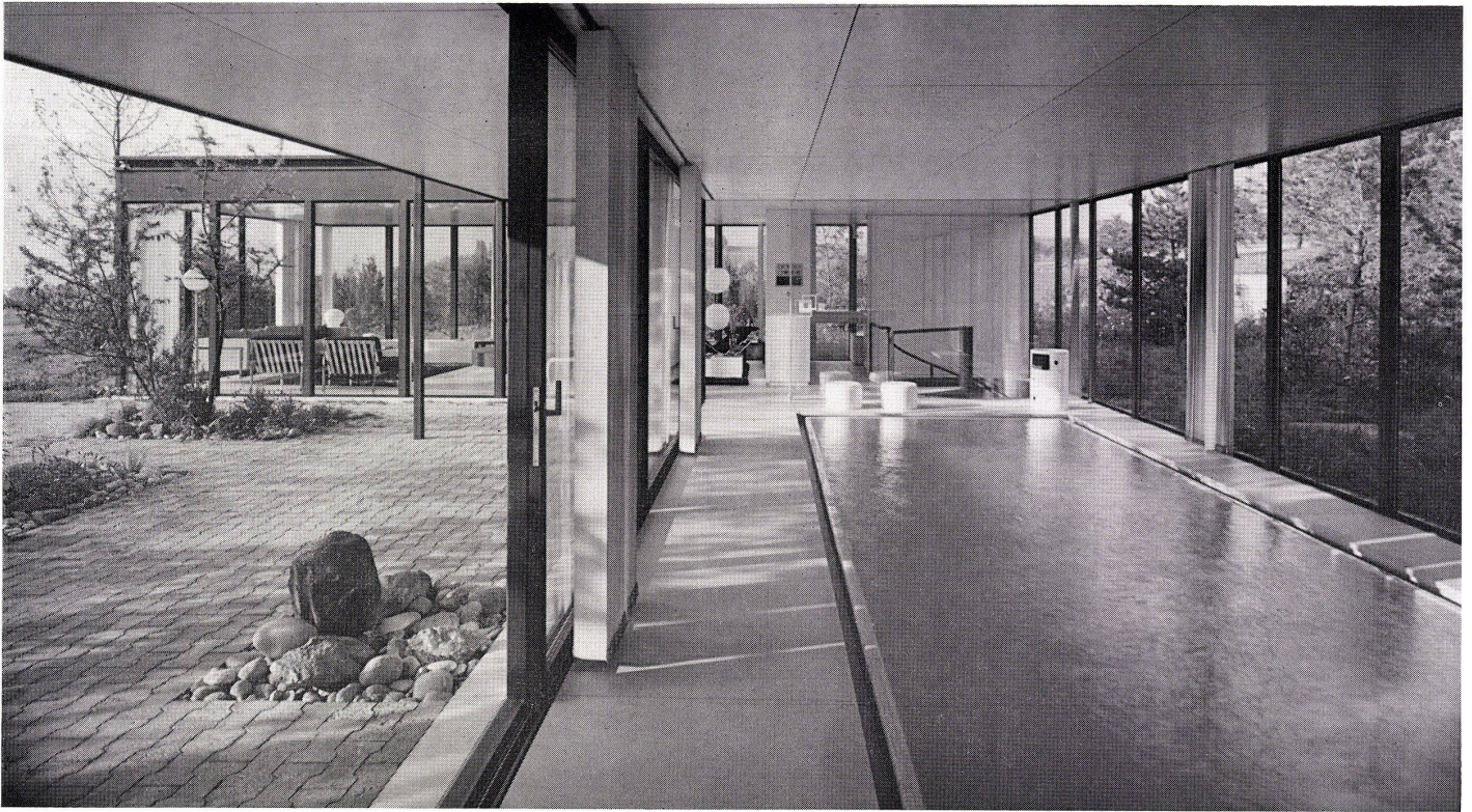
4 Blick vom Schwimmbad gegen Atrium, Wohnraum und Küche. Vue de la piscine vers l'atrium, séjour et cuisine. View from swimming pool to atrium, living area and kitchen.