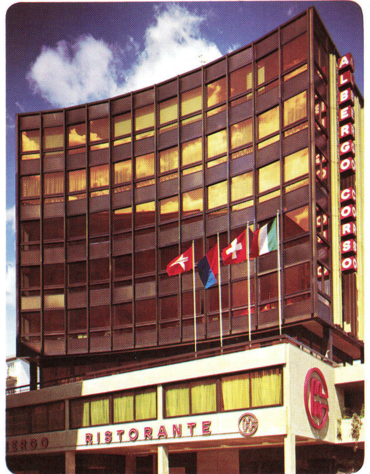
Immobile Commerciale Al Corso S. A. Chiasso – Schweiz, 1973 INFRASTOP-Gold 40/26 – Studio Grassi + Co., Chiasso