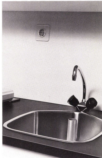
Eingebautes Abwaschbecken mit Mischbatterie und Steckdose für Haushaltgeräte