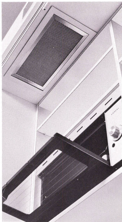
Kleinbackofen mit Ventilationselement für Kochplatten und Backofen