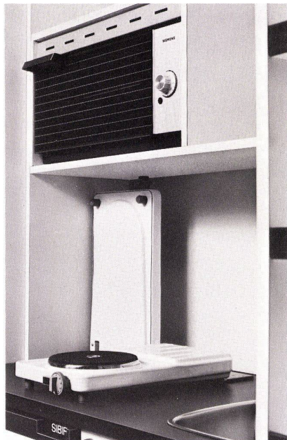
Aufklappbare Kochplatten mit Backofen