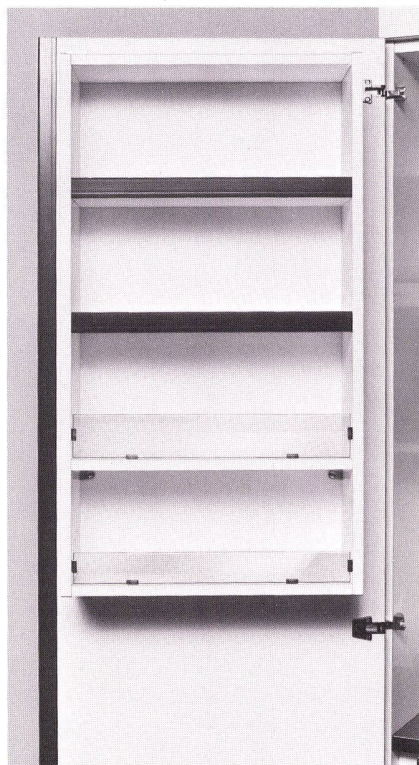
Ablagefächer in den Türen