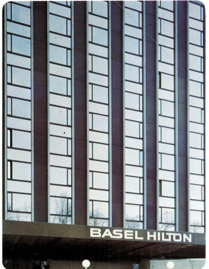
Hotel Basel Hilton, Basel, Schweiz, 1975 INFRASTOP-Silber 36/33 T – Arch. Rickenbacher+Wegmann, Basel

FLACHGLAS AG ...ein guter Name für gutes Glas