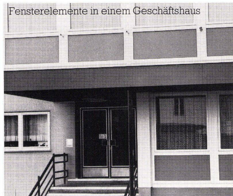
Fensterelemente in einem Geschäftshaus

Konstruktionsdetails, EMPA-Prüfberichte, technische Daten sowie Anschriften von Fensterbaubetrieben erhalten Sie durch: