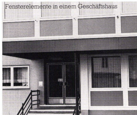
Fensterelemente in einem Geschäftshaus

Konstruktionsdetails, EMPA-Prüfberichte, technische Daten sowie Anschriften von Fensterbaubetrieben erhalten Sie durch: