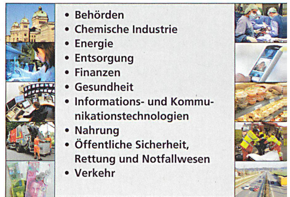
Kritische Infrastruktur-Sektoren in der Schweiz.

Für einzelne kritische Infrastruktur-Teilsektoren und insbesondere für darin enthaltene Objekte existieren in der Schweiz zum Teil bereits weit fortgeschrittene Schutzmassnahmen. Lange Zeit gefehlt haben aber eine sektorübergreifende Koordination und ein einheitliches Vorgehen auf nationaler Ebene. Aus diesem Grund hat der Bundesrat das Bundesamt für Bevölkerungsschutz BABS mit der Koordination der Arbeiten im SKI-Bereich beauftragt. Eine interdepartementale Arbeitsgruppe (AG SKI) erarbeitete in der Folge einen Bericht, in dem u.a. die wichtigsten Definitionen festgehalten, die für die Schweiz als kritisch einzustufenden (Teil-)Sektoren identifiziert und das weitere Vorgehen festgelegt wurden. Der Bundesrat nahm diesen Bericht am 4. Juli 2007 zustimmend zur Kenntnis und beauftragte die AG SKI, verschiedene Projekte zur Vertiefung des Verständnisses durch-