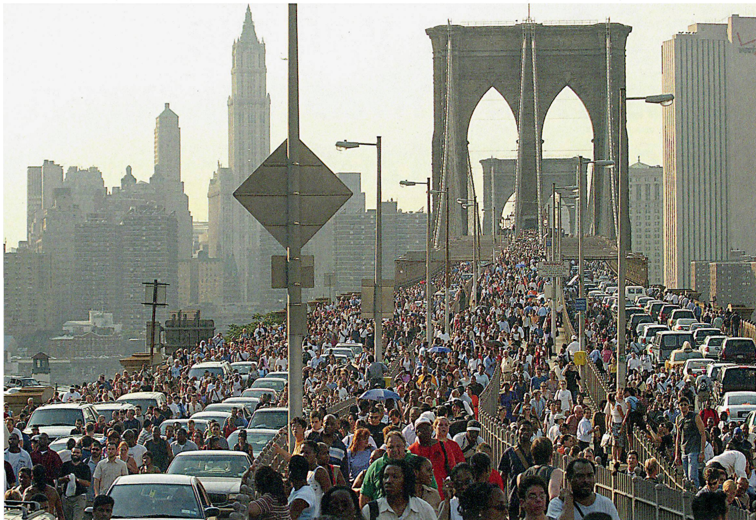
Im Sommer 2003 führte ein Stromausfall zu einem Zusammenbruch des Verkehrs in New York.

zuführen, um bis Ende 2011 eine nationale SKI-Strategie erarbeiten zu können.