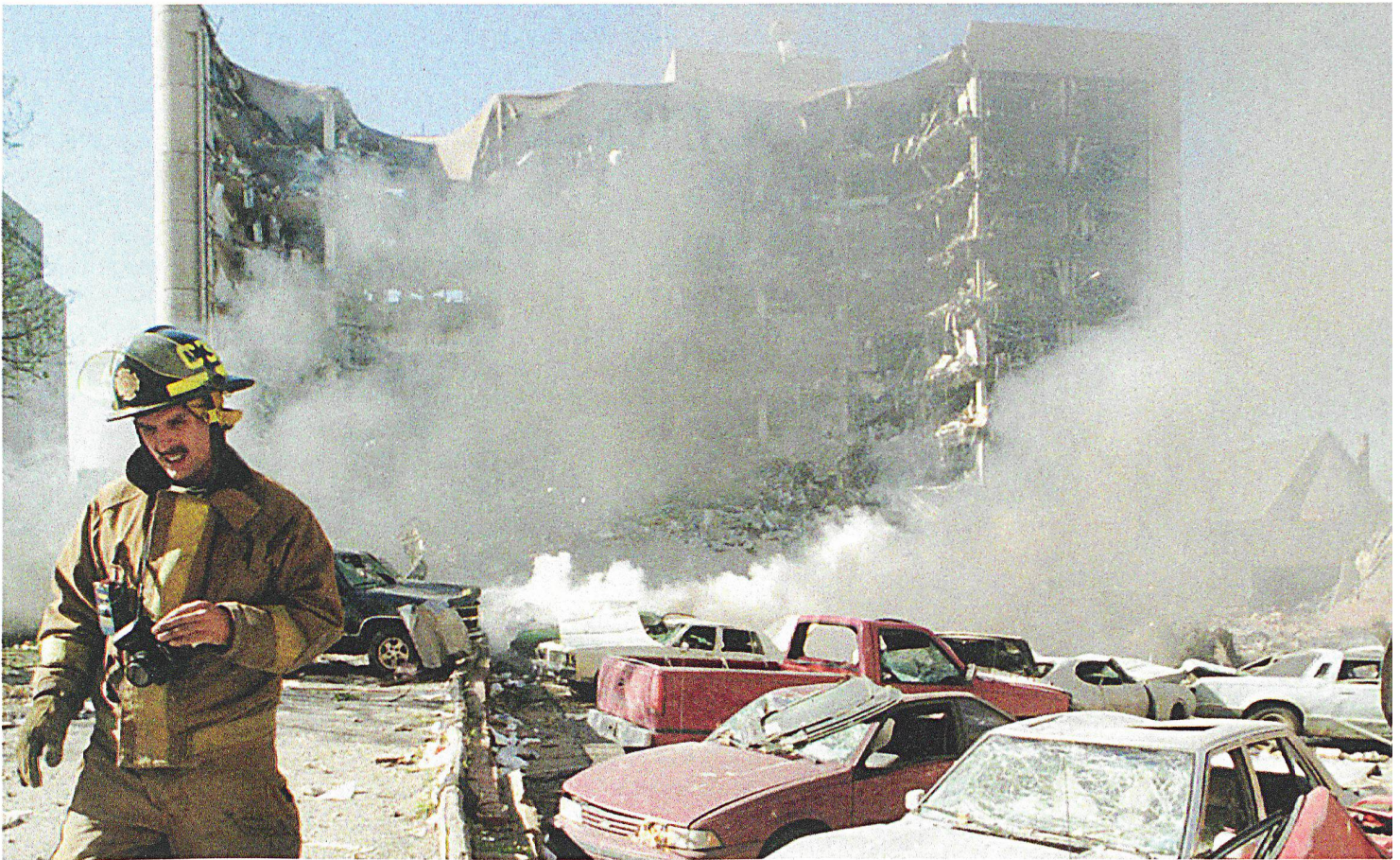
Am 19. April 1995 zerstörte die Explosion einer Autobombe das Alfred-P.-Murrah-Regierungsgebäude in Oklahoma City. 168 Menschen starben, 800 wurden verletzt. In dem vor dem Gebäude abgestellten Wagen befanden sich 2300 kg des Mischsprengstoffs ANNM (Ammoniumnitrat und Nitromethan). Dies entspricht einer Ladung von rund 1800 kg TNT.

Die Detonation ist mit grossen mechanischen und auch psychologischen Wirkungen verbunden, der Sprengstoff ist vergleichsweise leicht verfügbar und die Handhabung ist ebenfalls unkompliziert. Für den Einsatz der Bombe werden bevorzugt Strassenfahrzeuge verwendet, weil erstens aufgrund der Mobilität Fahrzeugbomben auch bei grossen Ladungen vielseitig einsetzbar sind, zweitens sehr grosse Sprengsätze eingesetzt werden können (weshalb es nicht immer notwendig ist, bis zum eigentlichen Ziel vorzudringen) und drittens bei Selbstmordattentaten die Sprengladung möglicherweise doch sehr nahe ans Ziel gebracht werden kann.