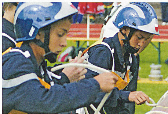
Konzentration anlässlich eines Wettkampfes in Lausanne.